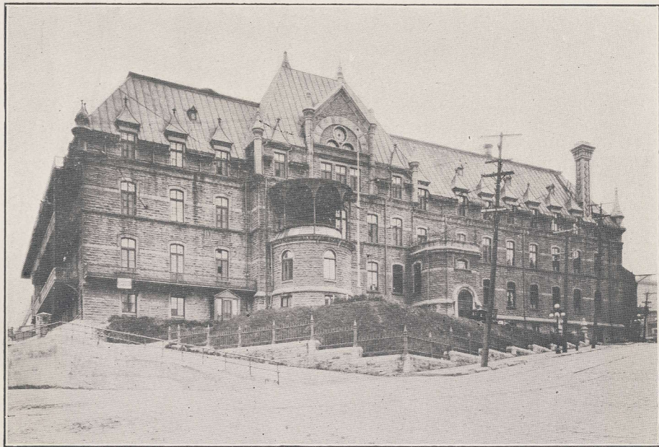
FAÇADE PRINCIPALE DE L'HÔTEL-DIEU DE QUÉBEC