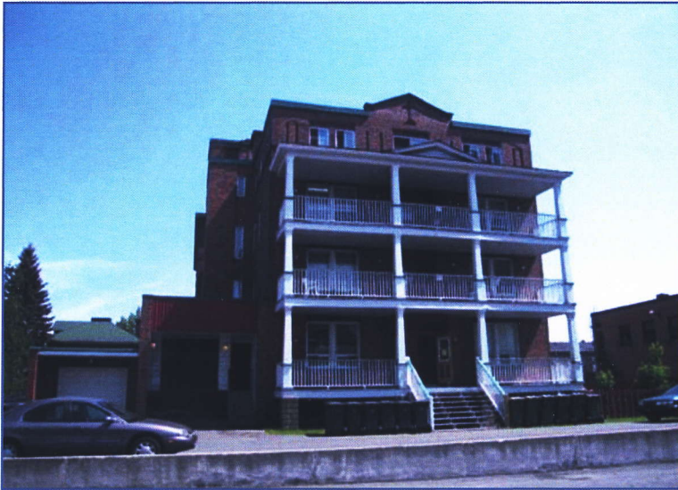
Première annexe dont les travaux se terminent en 1930. Elle est construite derrière le troisième hôpital qui est démolì lors de la prise de la photo.

Les demandes en soins aux malades augmentent sans cesse et avec l'arrivée de nouveaux médecins, il faut déjà songer à agrandir l'hôpital.