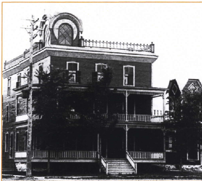
CSSS Drummond © Ephrem Archambault

L'Hôtel Corona devient le premier hôpital de 1910 à 1915. Il est situé à l'angle des rues Cockburn et Lindsay.