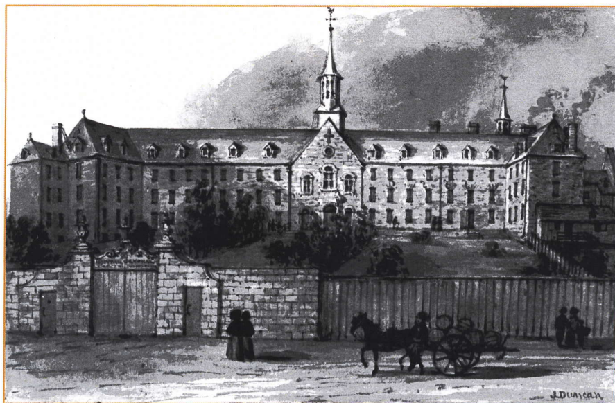
Réf. : L'Histoire des Sœurs Grises

En 1747, la gestion de l'Hôpital général de Montréal est confiée aux Sœurs de la Charité (Sœurs Grises).