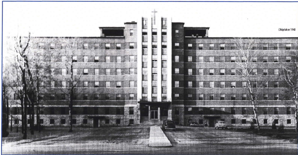
L'Hôpital Sainte-Croix de Drummondville, rue Heriot, en 1949.